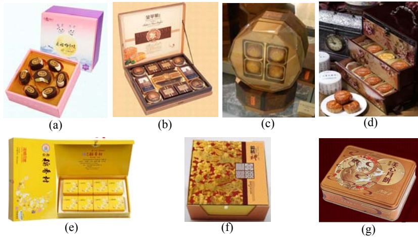
图 3 几种典型月饼礼盒包装

以几种典型的月饼礼盒包装为例，进行包装奢侈度的综合评价验证。图 3a 外包装采用卡纸材质，内衬特别设计了卡槽，月饼无需单独包装即可卡入固定。图 3b 外包装为马口铁，内包装采用卡纸盒独立包装，存放空间呈非规则布置。图 3c 外包装采用塑料制成规则的多面体造型，内包装采用复合塑料袋和塑料底托独立存放月饼。图 3d 外包装为木质，设计成复古式抽屉结构，内包装才用塑料底托固定并隔开月饼。图 3e 外包装为卡纸材质，内包装采用泡沫衬垫和卡纸盒将月饼独立存放。图 3f 外包装为绸缎布包裹硬纸板粘合制成，内包装采用丝绸作内饰，以塑料袋和塑料底托独立存放月饼。图 3g 外包装采用马口铁制成，内包装则是透明塑料袋和塑料底托存放月饼。