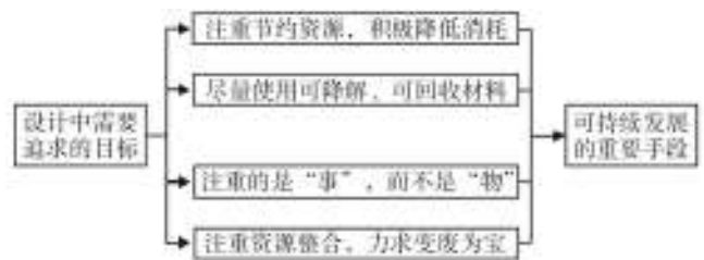
图2 设计应追求的目标

来，当人们谈及创新时其实意味着设计”。如今，作为创新的主要手段，设计已成了经济发展的新热点，随着设计介入人们生活的程度不断加深，其巨大的商业价值也正逐渐展现出来。尽管如此，但要将设计与“可持续发展”相提并论，人们似乎一时还难以理解。前面已谈到了“可持续发展”的关键是要实现资源的可持续开发利用。那么如何才能通过合理的设计战略来实现这一目标呢？鲍尔·豪肯提出的主要战略：“提高资源的生产率；通过生物的方式减少或转变废料；将商品与购买者的经济关系变成服务与流通的经济关系；向自然资本投资”。这些战略都是彼此相关、互为依存的，它们也与设计有着非常直接的关系，设计应追求的目标见图2。