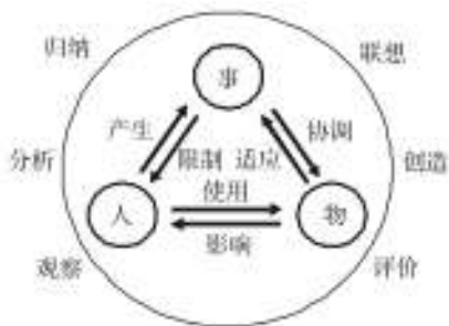
图1 系统性设计思维模式

设计是一个系统工程，它将人、物、事紧密地联系在一起，共同构筑了一个动态的系统。在这一体系中，三者既相互作用又相互依存，其中“事”起了关键性的作用，它决定着“人”的行为和“物”的性质。好的设计战略其实就是要将三者协调成一种平衡的关系，因为，过分强调任何一方，都会招致整个系统的失衡。例如：汽车的作用是为了让人们能够方便自如地“移动”，但是，如果只是一味地发展汽车（“移动”的内部因素），而不去解决与之相关的环境、条件、设施和交通规则等因素（“移动”的外部因素），就会导致整个交通系统因不堪重负而陷于瘫痪，最终，仍旧无法解决人们“移动”的问题。相反，如果只注重交通设施、法规和外部环境的建设，而忽略汽车本身的发展，就会造成两者的相互脱节，从而导致资源的巨大浪费。由此可见，在制定设计战略时必须统筹兼顾，只有“适度”地发展目标系统中的每一方，并使其相互协调，才能最终获得较完美的结局，系统性设计思维模式，见图1。