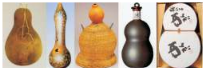
图3 包装形态中的葫芦造型

广大劳动人民通过掌握天然材料的特性,将之合理、科学地应用于包装设计中,其用材的合理性,制作的巧妙性以及装饰造型的美感,充分体现了包装设计中追求的形式与功能的完美统一,对于现代包装形态设计仍然具有很大的启迪和借鉴作用。人们用葫芦装药盛酒,此方法在古代被普遍应用。葫芦外壳坚硬,保护好,能起到良好的抗腐防潮作用。它除了外形美观,而且便于携带。在现代,葫芦直接作为包装材料已很少被使用,但它那为人喜爱的造型特点常被应用到产品包装设计中。包装形态中的葫芦造型见图3。