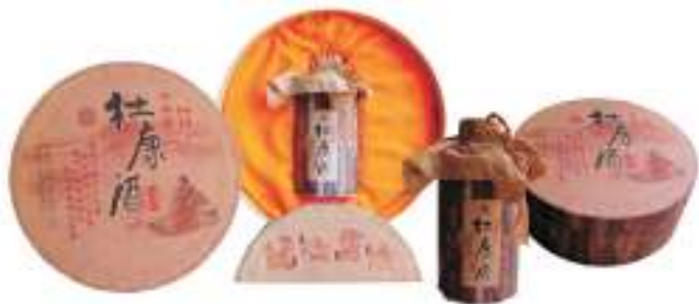
图6 运用材料本身的色彩、纹理、质地的包装

色彩在包装装潢设计中担负着两重任务:一是传达商品的特性;二是引起消费者感情的共鸣。色彩具有象征性,能使人产生各种丰富的联想。同样,色彩也具有感情特征,能使人引起感情上的共鸣。色彩是表现商品整体形象中最鲜明、最敏感的视觉要素,通过色彩的象征性和感情特征可以体现出商品的不同特性。如运用材料本身的色彩、纹理、质地的包装,见图6。