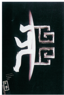
图3 韩家英招贴设计作品

过程中逐渐形成的 [7] 。例如平面设计师韩家英为《天涯》杂志设计的招贴,见图3,巧妙地将本土文化元素与汉字结合,采用现代版式,融合东方文化思想,营造出了招贴设计的本土语境,这种以传统文化与现代审美结合的镜像式新风格,体现出了杂志的独特个性,增强了汉字招贴对文化设计的引导作用。