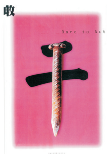
图1 张达利招贴设计作品