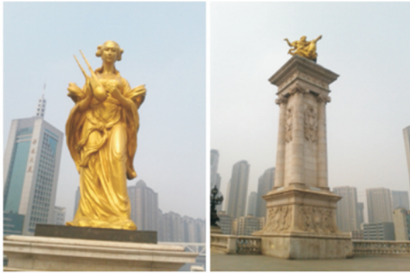
图2 北安桥桥梁装饰

题材,4种动物每只之上分别雕一人骑于4种动物上的形态,再将这4种雕像分别雕于桥头4个高大的柱子上。栩栩如生的形象配上金碧辉煌的色彩,巧妙地融合了中西方文化,气度非凡 [4] 。