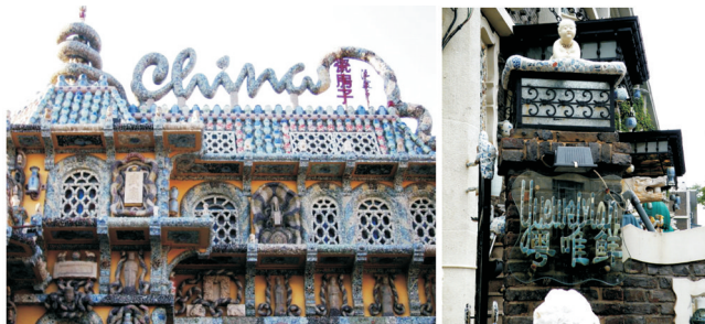
图1 瓷房子和粤唯鲜

元素,将中式的质朴古典与法国的精致典雅结合得恰到好处,渗透着超凡脱俗的魅力。据说“粤唯鲜是世界上第一个将饮食与文化连接在一起的餐厅”,著名作家冯骥才因此为该馆题词“能吃的博物馆”。