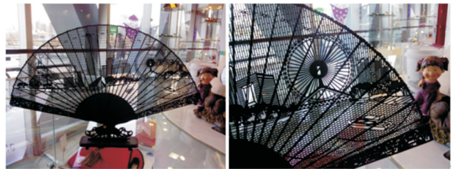
图3 摩天轮旅游产品——扇子

入北方平原的老城厢文化;另一个是近代入口:由老龙头火车站下车,一过万国桥,满眼外来建筑突兀奇异,恍如异国,这便是天津最有特色的文化风光” [7] 。天津城市文化特征的展现,当属折扇的设计最能体现天津现代设计的痕迹。一把木质折扇,耸立的天津建筑点缀在扇叶之上,代表天津城市旧址的鼓楼,承载外来文化的意大利风情街的西洋建筑、体现现代天津城市精神的“天津之眼”,在一把小小的扇子上承载了天津近代历史的变迁,微风轻拂,一起扇动的是城市的记录,是天津的历史,见图3。