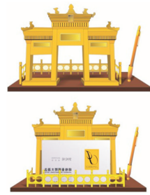
图3 金属名片夹摆件设计

据统计,珠海现有考古遗址142处、墓葬53处、建筑89处、摩崖22处、园林4处。目前,全市有各级文物保护单位29处。其中,国家级两处、省级4处、市级20处、区级3处 [6] 。其中包括:中西合璧风格建筑的代表——陈芳家宅,清代南祠堂的典范——杨氏大宗祠,岭南民居建筑群的翘楚——会同村,岭南园林艺术的代表——共乐园。由笔者设计指导的金属名片夹摆件见图3,就以陈芳故居中具有代表性特征的梅溪牌坊遗址为符号特征,设计的一款金属材质的名牌夹。此外,珠海人崇文重教的观念使得珠海曾一度书院兴盛。凤池书院、凤山书院、金山书院、三山书院、和风书院,造就了一批批士子名宦,至今保存完好。珠海现在的很多公园、沿海石壁上都有历史上文人墨客的题字或留笔,使得其秀美的自然景观更显典雅底蕴 [7] 。由笔者设计指导的木质酒瓶塞套装设计见图4,在设计上将珠海人文建筑特点的符号与功能相结合,以套