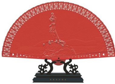
图5 渔女铜质摆件设计