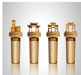
图4 木质酒瓶塞套装设计

Fig.4 Wooden wine bottle plug suit design