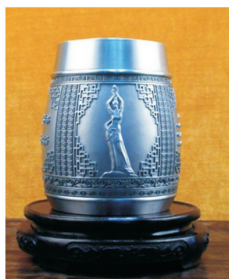
图1 茶叶罐摆件设计

第二阶段,进入到20世纪,珠海市的城市形象越来越被世界所关注,各个领域的世界性交流也越来越多,其中用来展示城市文化形象的礼品的作用越来越重要。传统的旅游纪念品成为了城市符号的代名词,用“浓缩城市精华,彰显城市魅力” [1] 来描述文化礼品的重要性一点也不为过。但纵观珠海市产品的设计形式仍然是以珠海渔女为题材的各类材质的摆件为主,在装饰画、茶杯、茶叶罐等载体上搭配渔女的标志性特征,从设计创新的角度试图满足大众的审美需要。笔者在珠海典藏城市文化发展有限公司展厅拍下的旅游文化礼品的实物照片,见图1,把二维的渔女雕在茶叶罐上,将城市文化礼品通过较高档的金属材质与实用功能结合起来。