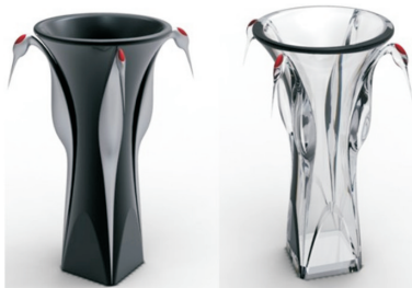
图6 鹤舞玻璃质摆件设计

蹈。市场上各类模仿白鹤的神态动作制作而成的各种工艺摆件一直是珠海文化类的主要标志。针对这一代表性符号,笔者设计指导的鹤舞玻璃质摆件见图6,从鹤舞的动作形态出发,与敦厚的造型载体相融合,力求体现文化礼品的厚重感。