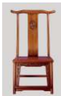
图 1 靠背椅 Fig.1 Backrest chair

具体来说，明式椅的常见形式有以下 4 种：（1）靠背椅见图 1（图片摘自昵图网），明式椅中只有靠背、没有扶手的椅子被称为靠背椅，其中，靠背椅中最典型和普及的是灯挂椅，即以悬挂灯盏的竹质灯架为椅背原型设计的椅子；（2）扶手椅，靠背和扶手都有的明式椅被称为扶手椅，扶手椅中有 3 类形式最为常见，分别是靠背低矮并与椅面垂直的玫瑰椅，又称文椅，搭脑和扶手都出头的四出头官帽椅见图 2（图片摘自瑞阳书院官方微信）和扶手、搭脑不出头，前后腿弯转相交的南官帽椅；（3）圈椅见图 3（图片摘自昵图网），圈椅即扶手与椅背曲线融为一体的明式椅，其形态婉转柔和，形如马蹄，因而又被西方称为马掌椅；（4）交椅见图 4（图片摘自深圳市书法院网站），即交机同椅背融合的椅子，因其前后腿交叉而被称为交椅，交椅钉锅交接的部位用金属连结，可以折叠放置 [3] 。