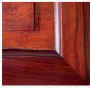
图6 斜交处木纹 Fig.6 Wood grain of angel

本身的特性。明式椅尤其讲究纹理质地，材料中有漂亮纹理或是节瘤纹的木材常被放在最显眼的部位，有结子或是比较畸形的木材则被放在不显眼的部分，或是将不同的纹理进行巧妙地安排，使其自然流畅，使木材本身具有的天然之美被发挥得淋漓尽致，比如斜交处木纹见图6，斜交处的木纹被巧妙地连接在一起，宛若天成。