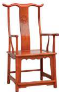
图 2 官帽椅 Fig.2 Armchair