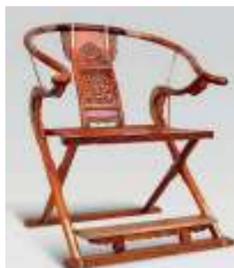
图 4 交椅 Fig.4 Intersecting chair