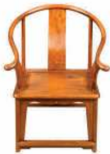
图 3 圈椅 Fig.3 Round-backed armchair