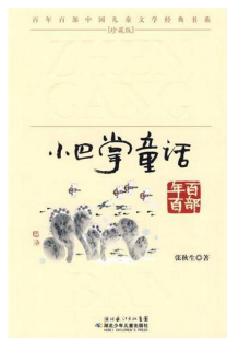
图4 《神奇的造字工厂》 封面设计 Fig.4 "The Factory Mak- ing Magic" cover design

厚度就成了营造特定意境的关键因素。周建明设计的《叶圣陶儿童文学全集》封面见图5,整个封面除了书籍名称以外,只有简单的花纹元素点缀,设计风格较为简洁,但简洁不代表简单,其关键在于书籍封面选用肌理较强的艺术纸,搭配烫金元素的装饰,瞬间给人经典、宁静、低调、奢华的厚重感,这样材质的选择符合书籍内容的精神气质,能将小读者带进文学的意境中。