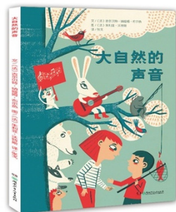
图1 《大自然的声音》封面设计 Fig.1 "Nature's Voice" cover design

以形造境就是用封面中所描绘的客观图景表达主观情感而营造的艺术境界,也是中国美学特征中“以形写意”的艺术表现 [5] 。“形”是事物的表象,“意”是揭示事物内在的本质。形是意存在的依托,意是赋予形的生命,两者之间强调表里相辅,相互依存,相互为用,意形交融合二而一,因此,在书籍设计中“以形表意,以意传情”是创设意境美的主要手法,文学童书封面的意境美,正是运用图形本身蕴含的特定韵味和情境所营造的。文学童书封面中的插图是儿童获取书籍信息的主要途径,是体现书籍内涵的外在展现。图像不但能将书籍中的知识形象传递给孩子,还可以通过自身直观的艺术形象生动、清晰地呈现给孩子们,引发孩子们的意境联想,对营造封面的意境美有一定的催化作用。《大自然的声音》封面设计见图1(图1—4均摘自当当网),书中用故事的形式,讲述了孩子们去亲近大自然,聆听动物们与大自然的不同声音的故事,因此人物与森林中的动物就成了封面图形的主体,设计师采用拟人的手法来表现动物与人的和谐相处,在寻找合适的表达方式上,所有图形的艺术处理都没有脱离书籍的内涵和气质。如果选择写实的人物和风景来表现,则过于直白,有损文学童书的童趣和意蕴;如果选择太抽象的造型,则又很难传达亲近大自然、认识大自然、聆听大自然的奇思妙想,因此,用插画的艺术形式对封面进行了处理,整体画面在表达儿童活泼趣味性的同时,融入艺术气息,增加文学笔墨的韵味。至此,封面图形通过插画的艺术表达,巧妙地将“意”引入到形式美中,让图形的传情达意得到读者的认可。