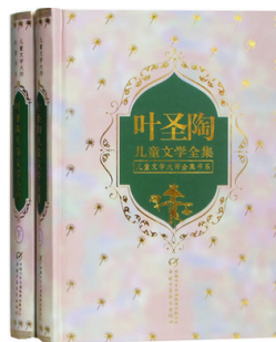
图5 《叶圣陶儿童文学全集》封面设计 Fig.5 "YE Sheng-tao children's literature" cover design

厚度就成了营造特定意境的关键因素。周建明设计的《叶圣陶儿童文学全集》封面见图5,整个封面除了书籍名称以外,只有简单的花纹元素点缀,设计风格较为简洁,但简洁不代表简单,其关键在于书籍封面选用肌理较强的艺术纸,搭配烫金元素的装饰,瞬间给人经典、宁静、低调、奢华的厚重感,这样材质的选择符合书籍内容的精神气质,能将小读者带进文学的意境中。