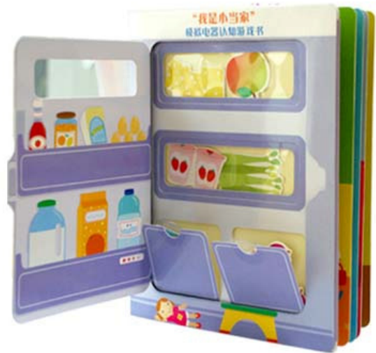
图3 认知游戏书 Fig.3 Cognitive game book

满足互动性的情感需求。互动是创造经验、传达感情与反馈信息的综合关系 [5] ,阅读本身就是一种互动的方式,孩子们通过行为感官直接与书籍进行双向的互动沟通,在这个过程中孩子能够将自己的情绪情感进行外化与传递,这能够提高孩子参与主体情感投入的程度,为孩子提供选择的机会,从而满足儿童不同的互动体验需求 [9] 。因此,书籍的设计应从儿童的天性出发,在书中要尽可能带给孩子们愉悦的互动体验,让小读者们在游戏互动中体验情感,获取知识,使阅读不再枯燥,从而让孩子爱上读书,享受阅读的乐趣。认知游戏书见图3,这是一本模拟电器认知游戏书,书籍根据儿童以具象形象为主的思维特点,采用游戏互动的方式向孩子进行生活知识的启蒙,孩子们能动手掀开“冰箱”门,可以将食物卡片镶嵌在书籍的页面上,对孩子来说这种模拟真实场景的互动形式是易于理解并乐于接受的,孩子在游戏互动的同时,既能增长知识,又能得到无限的快乐。