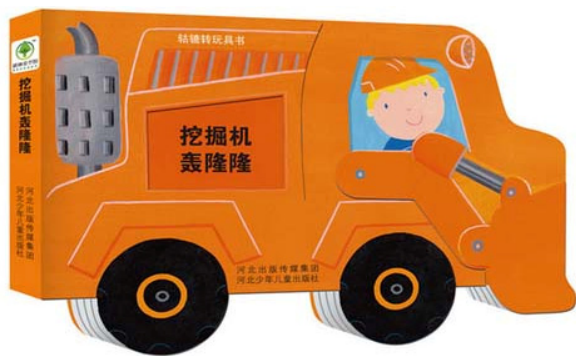
图2 儿童玩具书 Fig.2 Children's toys book

满足易读性的情感需求。儿童的逻辑思维、注意力、记忆力等方面正处于发育阶段,阅读形式过于复杂的书籍很容易使孩子望而生畏,在阅读时产生挫败感 [7] 。因此,孩子们渴望易读,并且这种需求要远远高于成人。易用性的情感需求主要体现在易见、易学、易用的满意程度上。与成人不同,儿童缺乏稳定性、持续性、系统性的观察力,接触到书籍时,可能会被某个元素所吸引,但对于功能的探索并不能长久维持,因此需要对书籍某些功能与操作进行强调,让孩子更容易发现;儿童的探索能力与其探索欲不相匹配,识字能力较弱,孩子们的学习主要依靠主观感觉经验,因此书籍中应多使用通俗易懂的形式来达到儿童易学的目的。儿童呈现出手小不灵活,手脚力量有限的特点,因此书籍的开本、材质、装订工艺等方面要依据儿童阅读的客观规律,使孩子能正确、快捷、愉悦、有效的阅读书籍,为孩子们的阅读带来便利,以此满足小读者生理和心理方面的情感需求。