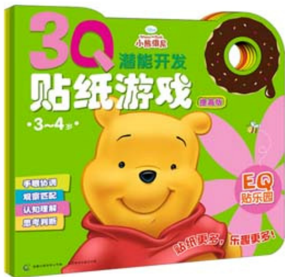
图 4 儿童益智书籍

某个事物时，孩子曾经接触过这个事物的所有感受都在脑海中掠过，孩子们综合记忆中的各种因素会做出一个总体的评价，相对熟悉、有趣的事物能唤起孩子们的记忆。儿童益智书籍见图 4，这是一本有关幼儿早期潜能开发的游戏书，诚实纯真、乐于助人的维尼与孩子们有着相近的性格特点，瞬间拉近了与孩子之间的距离，营造了一种亲切感，所以小熊维尼一直深受世界各地小朋友的喜爱，孩子们也热衷于含有小熊维尼的事物，当孩子看到这些事物时，能瞬间想到经典的动画故事情节，勾起孩子们的美好回忆，正是这些回忆激发了小读者的阅读乐趣，让孩子成为书籍的忠实读者。