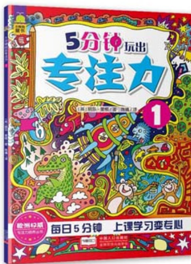
图 1 儿童学习书籍

于激情和张力,以此提升书籍画面的视觉冲击力,达到隐喻“丰富”的情感需求。儿童学习书籍见图 1,画面中绚丽多彩的颜色,可以给儿童产生一个良好的大脑刺激;画面充斥着图案的密集感,使画面气氛热闹欢乐;自由变幻的构图可以给儿童营造一个无拘无束、自由愉快的氛围,让孩子们在阅读时情感上能得到宣泄、产生共鸣。