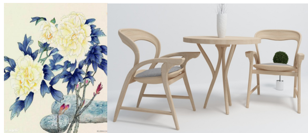
图 3 仿生简欧餐桌椅设计效果