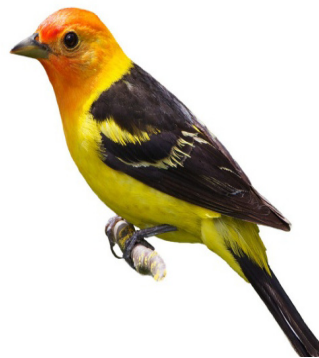
图 2 仿生对象 Fig.2 Bionic target

和“简欧”两种元素作为同构思维对象，应用改性速生杨木进行家具创新设计。仿生设计对象选取外形优美又有深刻意蕴的两个形象鸟和花，见图 2，将鸟轻盈与灵动的动态感、外型上流畅的线条轮廓和纤小的体积应用在餐椅家具设计中，见图 3。