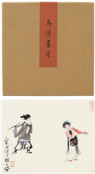
图1 《马得画片》 Fig.1 "Ma De Picture"

《马得画片》(见图1)精选了36幅马得先生的代表作，以活页画片形式出版，书装设计用瓦楞纸盒。