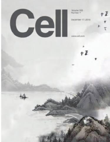
图5 "Cell" Fig.5 "Cell"

墨给人的空间感,书中留白使得作品更有意境美。近处的景色以树木为主,留白可想象成山间的湖面,远处就是山峦叠嶂,这本书将化学重编程过程用水墨画的形式表现出来。版式的巧妙安排结合水墨元素的留白,使传统文化设计元素与科技发展与时俱进,拓宽了水墨元素的应用领域,提升了书籍的意蕴。