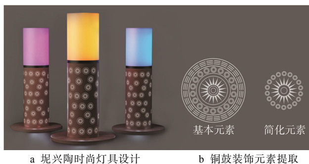
图4 坭兴陶时尚灯具设计 Fig.4 Nixing pottery fashion lamp design

时尚灯具见图4,造型简洁大方,以“点”的装饰为主。灯具创新设计应用了组合设计法。上部透明灯罩与下部镂空灯罩相结合,透明灯罩为磨砂透明亚克力材质,镂空灯罩为坭兴陶材料,将坭兴陶雕刻装饰艺术融入产品设计中,坭兴陶的雕刻装饰特色鲜明,有线刻、平雕、浮雕、镂空、色泥填充、镶嵌、贴塑等装饰技法 [8] ,结合灯具功能需求,装饰部分采用镂空装饰,镂空图案为铜鼓图案。铜鼓是广西特色的文化遗产,迄今已有2700多年历史,鼓面为重点装饰部分,中心常配以太阳纹,外围则以晕圈装饰,与鼓边接近的圈带上铸着精美的圆雕装饰物。对基本提炼抽象简化,保留中心太阳纹与外围晕圈等核心视觉符号,应用于融入时尚灯具产品设计中。用户可根据需要上部或下部灯具开启灯具,也可以上下部分灯具全部打开。灯罩上盖是非接触式感应控制开关,可通过