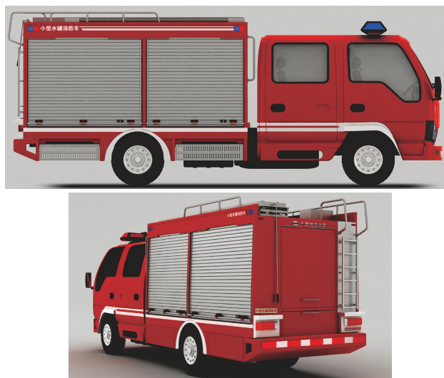
图 3 农用消防车设计效果

项目完成了数字化抢险救援车、油罐车、应急通讯车、农用消防车等特种车辆的设计，农用消防车设计效果见图 3，产品带来了显著的经济效益和社会效