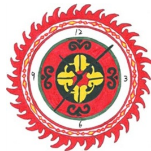
图 4 挂钟设计 Fig.4 Wall clock design