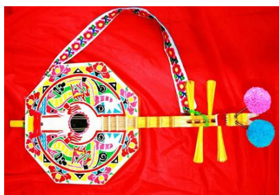
图7 彝族月琴 Fig.7 Yi ethnic Yueqin

彝族人非常热爱器乐歌舞,有许多具有民族特色的乐器,有些乐器与周边其他民族所共有,有些则独具特色。彝族的乐器种类极多,有编钟、葫芦笙、铜鼓、月琴、三弦、大扁鼓、口弦、马布、巴乌、笛等。彝族月琴是弹弦乐器(见图7),音箱为圆形的称作库竹、棱形称作的称八角琴。月琴是彝族重要的民族乐器,在男女青年的谈情说爱、庆祝节日时都要弹奏月琴。彝族人将自己的奔放的情感寄托在优美的月琴声中,显是出彝族人民对美好未来的向往;彝族大三弦是彝族弹拨弦鸣乐器(见图8),在火把节上,人们围着篝火欢快地弹着大三弦,大家纵情高歌,载歌载舞。铜鼓(见图9)是一种打击乐器,在历史发展中,它渐渐变成权力和财富的象征,被彝族人看作重要并且珍贵的重器或礼器,最终成为被祭祀的对象。铜鼓的体型适中,上面的纹案一般使用单弦分晕,构成大小宽窄的不断变化。铜鼓的纹案中,鼓面中心一般采用太阳纹,太阳纹分为两种,一种光芒是长的锐角,另一种光芒则是细长如针。彝族的乐器具有独特的造型和纹饰,旅游纪念品设计中可以提炼乐器的造型及其纹饰,运用在不同的旅游纪念品设计中,比如可以将乐器造型运用在音乐盒设计中,也可以运用的茶具或餐具等的设计中,还可以将乐器的纹饰运用于U盘、明信片、挎包。