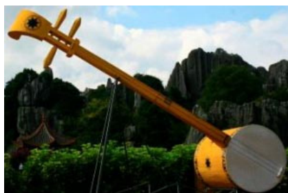
图8 彝族大三弦 Fig.8 Yi ethnic Dasanxuan