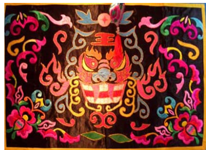
图 3 彝族刺绣 Fig.3 Yi ethnic embroidery

彝族刺绣的主题一般是自然景观、风俗习惯、历史故事等，彝族人创造了各种精美的刺绣艺术品。彝绣色彩丰富且鲜艳，红、橙、黄、绿、青、蓝、紫等多种原色被大量使用，鲜艳夺目的装饰纹样，使整体的服装生动自然、灵动跳跃，富丽多姿。彝族服饰自古有尚黑、喜红的特点。在彝族的刺绣的图案和纹饰中，图腾的图案和纹饰是以吉祥物的形式装饰于彝族服装之上的，彝族人认为这样的图案和纹饰，能够让神明庇佑族人（见图 3） [7] 。在旅游纪念品设计中可以尝试提取彝族刺绣图案的基础造型，以彝族刺绣图案的某些具有特征的元素作为基本单元，运用现代视觉设计原理进行图形变化，运用重复、发射、渐变等设计原理进行图案重构，形成符合现代审美又具有彝族民族风情的图案。也可以将刺绣图案立体化或者平面化的展现，还可以将刺绣图案艺术化的处理，结合不同的产品进行融合，可以应用在茶壶、茶托、餐具、音乐盒等设计中，还可以将太极图案的运用在 U 盘、明信片、书签、挎包等上面。比如笔者将从刺绣中提炼出来的图腾图案应用于挂钟设计（见图 4）中，不仅作为钟面的装饰，还可以是时间的指示点。火是彝族追求光明的象征，彝族人每年过火把节，就是祈祷火神护佑平安，在设计中融合了火的元素，将挂钟的整体造型设计为一个圆形的火盘造型，寓意平安、光明。