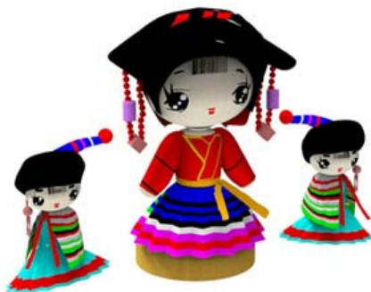
图 2 人偶设计 Fig.2 Cartoon design