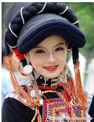
图 1 彝族服饰 Fig.1 Yi Ethnic costumes

彝族的服饰具有一种和谐、统一、整体性的审美感受 [5] 。其独特的造型、色彩鲜艳的图案，衣服、帽子、裙子、裤子、鞋子、包袋的统一，不仅突出了某种图纹基调，同时又表现出不同图纹整体的协调一致性，具有独特的视觉效果（见图 1） [6] 。旅游纪念品设计可以从服饰中提炼图案，可以运用在不同的产品设计中，比如设计家居用品；可以高档化和平民化结合，形成多种类、不同档次的产品体系，运用系列化设计方案，设计针对不同人群的产品，形成类别不同、档次不同的产品；可以以某一个主题设计一系列的人偶，比如不同年龄、不同服饰、不同性别，也可以设计不同质地的人偶，比如木质、陶质、布质等。系列人偶（见图 2）就是将服饰中提炼出来的造型应用在设计中，可爱有特色的人偶不仅受孩子们的欢迎，而且展现了彝族独特的民族风情。