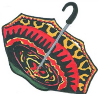
图6 雨伞设计 Fig.6 Umbrella design

在旅游纪念品开发中可以将传统的彝族漆器在保存民族本身特色的前提下结合现代审美元素进行设计,可以从造型、纹样、色彩3个方面进行提炼和借鉴 [10] ,结合不同的产品进行融合。比如将彝族漆器的造型设计借鉴到现代餐具、茶具设计中,在借鉴漆器造型时,可以借鉴其整体或者局部。彝族漆器的色彩以黑为主色,红色和黄色配合,色彩艳丽,具有独特的视觉美感。彝族漆器的纹样具有比较强的规律性,这种构成手法形成了比较强的节奏美感,可以运用在现代设计的很多方面。运用漆器纹样和色彩设计的雨