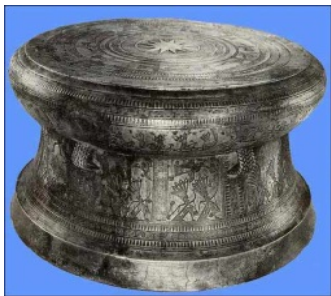
图 9 彝族铜鼓 Fig.9 Yi ethnic bronze drum

音乐盒系列设计（见图 10）就是结合了彝族的特色乐器、传统歌舞和服饰文化，结合转动装置设计而成的。音乐盒一（见图 10a）是以彝族传统的乐器——月琴作为整体的外观造型，琴体的背面是可以旋转收起的支撑架，琴体中间是采用透明材料制作可以绕轴旋转的圆，玻璃内部放置具有彝族特色、穿着彝族服装的人偶，这些人偶呈现的是彝族特色舞蹈的动作。在琴体内部装配可以旋转发声的音乐装置，发出