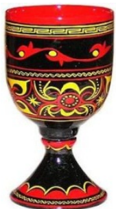
图5 彝族漆器 Fig.5 Yi ethnic lacquer ware

餐具基础上发展起来的民间手工艺品,具有装饰性、宗教性和抽象性 [8] ,彝族漆器的纹饰体现了漆器的抽象性。彝族漆器纹样多种多样,主要来源于自然、动植物、生活等。彝族人民通过摹拟,将自然界中的日月星辰、飞禽走兽、树木瓜果和山川河流等提炼出来,表现成为彝族丰富的漆器纹样。这些纹样使得彝族漆器具有独特的民族特色。彝族漆器的主要形态为动物和圆形,其中动物形态是彝族漆器中最具特色的形态,有人工形态和自然形态。人工造型依据禽鸟、动物的外形设计而成。彝族漆器的色彩搭配体现了彝族的宗教性。自然形态是采用动物的器官来制作漆器,比如羚羊角、牛角等。彝族的“三色文化”是指彝族漆器使用的黑、红、黄三色。在彝族文化中,黑色是大地之色,庄重、肃穆;红色代表火,热烈、奔放;黄色代表阳光,光明、幸福 [9] 。这3种颜色在彝族漆器中,以黑为主色,红色和黄色配合,间隔使用,是彝族漆器色彩艳丽,充满彝族风韵。