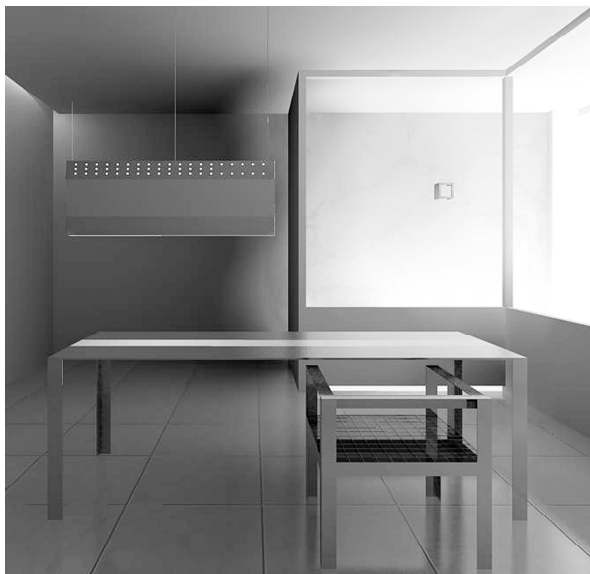
图1 幽明桌、幽明椅、幽明灯正视图

《道德经》载, [5] “三十辐,共一毂,当其无,有车之用。埴埴以为器,当其无,有器之用。凿户牖以为室,当其无,有室之用。故有之以为利,无之以为用。”这是老子对于造物观念有与无关系的论述,30根辐条汇集在一个车毂上,正因为有了中间空的部分,才有了车的作用;以黏土制造的器具,正因为有了中空的部分,才有器具的作用;开了窗户的房屋,因为有了室内空间才有房子的作用。一切造物正因为有了“空”的部分才有用。常人常常看到的是“有”,却忽略了“无”,有与无存在于一“物”间。对于有与无的思辨,能更好审视物用,物尽其用,一切基于日常(见图1)。《道德真经注》载, [6] “妙者,微之极也。世间万物始于微才能后成,始于无才可后生。故常无欲空虚,可以观其始物之妙。”观看物之“妙”,须懂得“无”的意义,“无”并不是没有,而是为“空”,“空”即是无限,也最充实。正象老子所云“大盈若冲,其用不穷。”