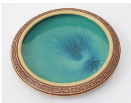
图1 外素内釉笔洗 Fig.1 Exterine glaze brush