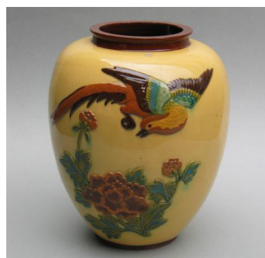
图3 耙花罐 Fig.3 Flower-pasted pot