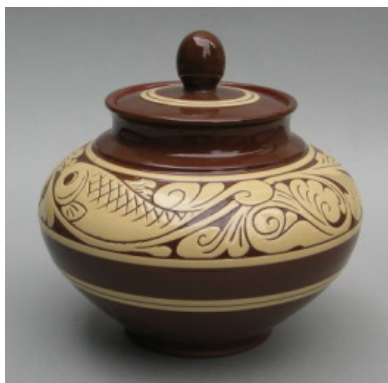
图 5 剔刻花糖罐