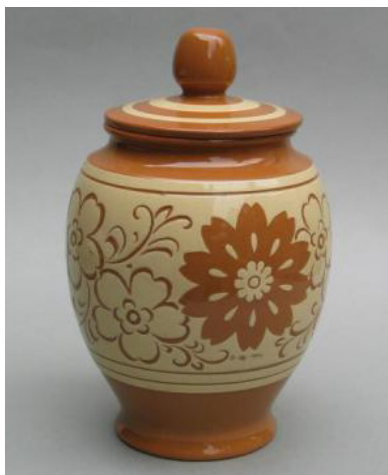
图 4 剪纸刻花罐