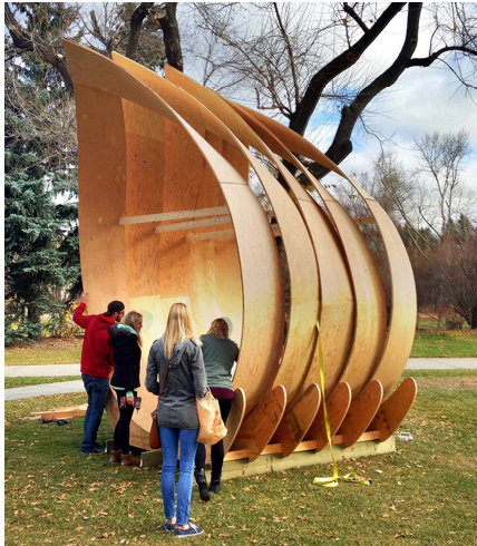
图 4 加拿大卡尔加里大学的“block-week” Fig.4 “block-week” of Pavilion plant of University of Calgary Canada