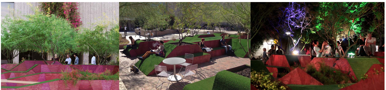
图3 亚利桑纳州大学中心广场公共设施

辟正六边形蜂窝结构的参与式校园农场。通过不定期举办种植体验活动鼓励师生参与,参与行为本身成为生态理念宣传的最佳实践。亚利桑纳州大学中心广场的设计建造综合了绘画、摄影艺术与大地艺术,集合了建筑学、音乐学、风景园林学、摄影学科学生的集体力量,唤醒了学生参与校园景观建设的自我意识,亚利桑纳州大学中心广场公共设施见图3。其二,创意吸引。与大规模资金投入的更新改造相比,具有创新思想的公共艺术作品更具传播性,也更有助于增强场所认同感与凝聚力 [10] 。例如加拿大卡尔加里大学每年举行的“block-week”活动,倡导学生们利用废弃材料,在一周时间内,自由建造理想的校园 block。借助每次活动的契机,学生们对公共艺术进行“自我诠释”,加拿大卡尔加里大学的“block-week”见图4。