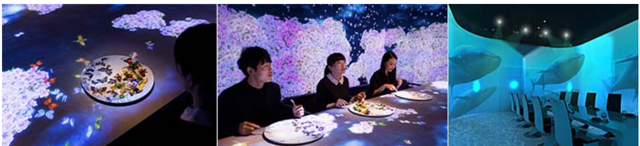
图 5 VR/AR 技术餐厅

行为维度包括身体体验、生活方式以及与品牌的互动。无人商店可以运用各种互动方式,如商店屏幕互动,VR/AR 互动等,VR 和 AR 从不同视角给消费者创造机会体验新奇的产品,带来了前所未有的、科幻前卫的购物体验。让用户体验无人零售的科技性、便捷性,以改善无人商店的购物效率和用户体验满意度。与此同时,广泛地研究消费者,尤其是针对关键消费群体。通过分析挖掘消费者的需求、习惯导致的交互行为,研发和完善无人商店的服务系统。日本佐贺牛餐厅采用现代声光电和虚拟现实 VR/AR 技术,从顾客进入餐厅,到点菜、上餐过程都有相应多媒体视听效果,由餐具延展到桌子以及整个空间里,给顾客带来全新的享受和奇幻般的试听、味蕾旅程,见图 5。