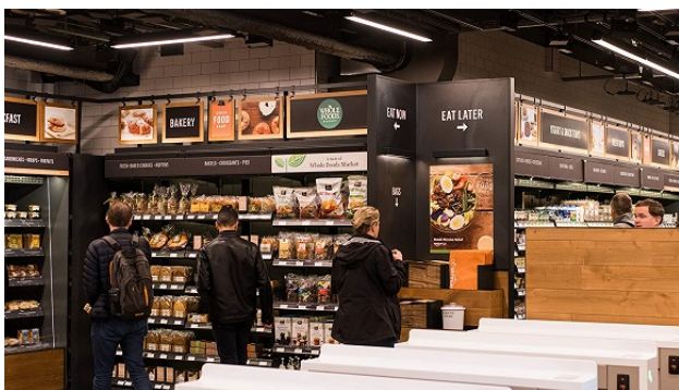
图3 Amazon Go Fig.3 Amazon Go

第一,技术存在稳定性问题。目前无法保证各种前沿技术的稳定性,高额的成本也增加了推广难度。目前的Amazon Go能完美运行的条件是:店里少于20人或当用户缓慢移动时,见图3。另外据笔者体验,“苏宁易购Biu”的刷脸识别不是特别灵敏,刷脸时调整了3次才成功,由此看来,想要真正达到“视觉刷脸”和“拿了就走”的体验,视觉识别、深度学习算法等一系列前沿技术还有待完善。