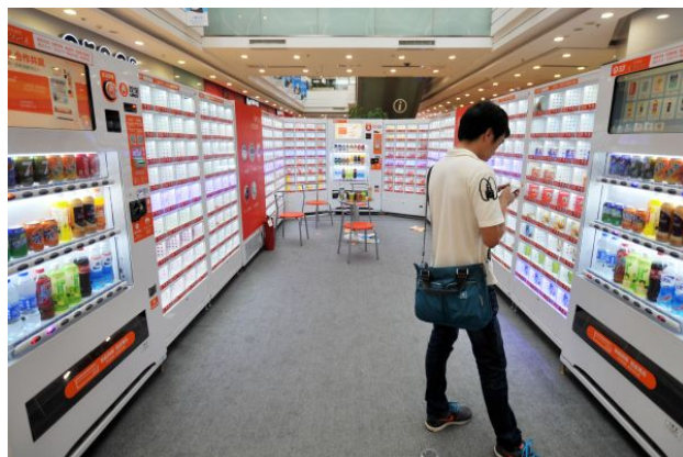
图4 F5未来商店 Fig.4 F5 future store

第二,无人商店面临的道德问题不容忽视。一方面,消费者对商品的反复拾取而导致的商品损耗以及货架混乱的问题。这不仅造成人工成本的增加,还可能影响消费者在店内的体验,对无人零售店引发负面的情绪。另一方面在无人商店内,没有人的监督难