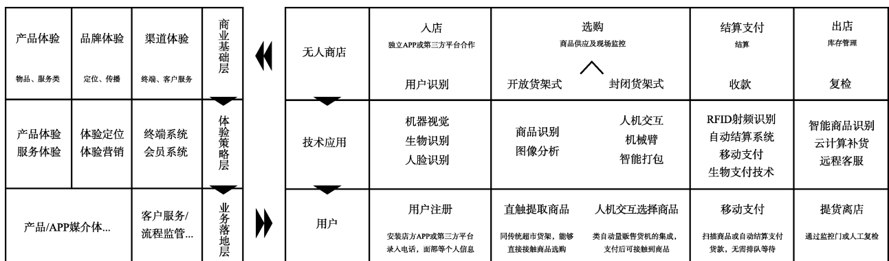
图 1 无人商店购物流程、体验层面 Fig.1 Shopping process and experience level of unmanned stores

无人商店在购物流程和体验层面与传统零售系统大相径庭，通过新兴技术的应用，彻底重构了消费者入店、选购、结算支付、离店的全流程，重塑了消费者的购物体验，见图 1。