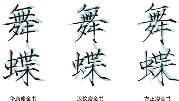
图4 字库瘦金体与原书法比较 Fig.4 Comparison of the Slender Gold font and the original calligraphy

字体是依托环境而变化的,没有一种字体绝对适用于各种情境,用处不同,对字体的要求也不尽相同,功能与审美并非对立的,它们都是使用者体验的一环。随着字体在显示屏上的大范围应用,屏幕的自发光