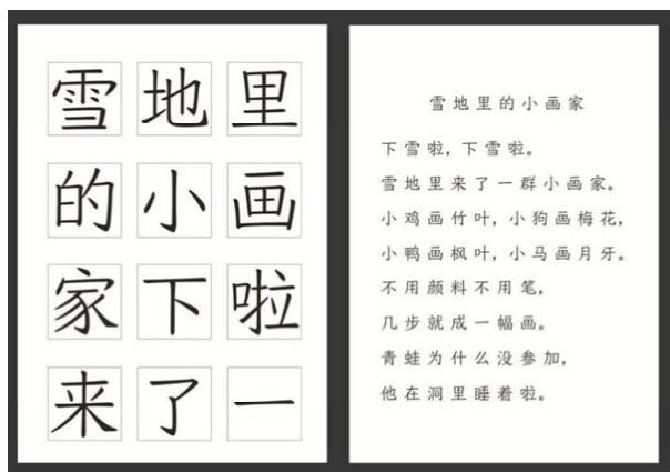
图 6 刘汉旭设计的教科书体

汉字书法字体规范的目的还是使用，如教科书字体设计就应着眼于形体的易读性，不宜过度表现书法性，特别是针对低龄学童的字体设计，应考虑到儿童的认知水平，简化复杂的视觉冗余，以免造成错觉，形成儿童学习的障碍。刘汉旭设计的教科书体《宜子孙》甲，就是建立在书法字体应用上的创新性设计，设计者弱化了书法的顿笔，降低书写痕迹，减少笔画之间的变化，通过提高统一性来适应低龄儿童的阅读，并不失书法美感的传达，见图 6。