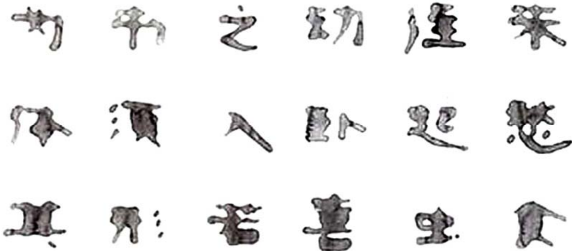
图8 《水之印》 Fig.8 "Water Mark"