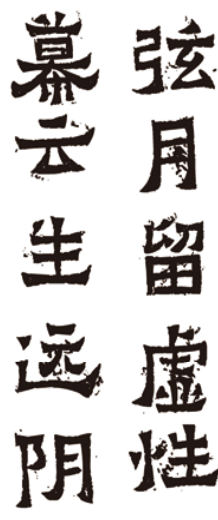
图3 苏新诗爨宝子碑 Fig.3 SU Xin-shi Cuan Baozi Stele

“数字技术只有用来制造‘情感的形式’的时候它才能走向艺术和人类的最终需要” [2] ,限于技术而丢失书法美感的设计是不足取的。作为设计者而言,需要对书法艺术本质进行深入地认识和分析,站在艺术审美的高度,在仔细描摹与修整过程中权衡把握两者之间的“度”。苏新诗“爨宝子碑体”是一款复刻字体,每一个偏旁和笔画在不同的字中都是不一样的,也就是说每一个字都是逐点调整、逐字制作完成的,工作量非常大,需要相当长的时间才能熟成。日本字游工房的创始人鸟海修先生提倡:在字体设计之初用“手写”的方法,不多考虑数字化的问题,即使是保留多一点手写的、感性的东西,他认为这才是字体最重要的。