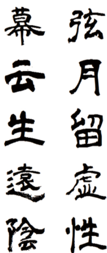
图2 青柳隶书 Fig.2 Aoyagireisyosimo

独美”的“飞白书”,就是对书写过程中笔墨意趣追求的体现。每个时代的书法都追求材料与创作相契合的最佳状态,书写的笔墨感、碑刻的金石味,都体现出独特的视觉趣味。这些“偶发性”、“原生态”的部分,如何通过电脑软件描绘出来,避免字体数字化后的形态缺损和浮滑感,的确需要设计师不断取舍、调整、提炼和再设计,再现书法的自然效果,表现出书写所特有的动人细节和意趣。例如日本青柳衡山的毛笔隶书体,就很好地表现出了书写时墨色润渴相生的韵味,与笔画的动势相得益彰,见图2。苏新诗爨宝子碑以《爨宝子碑》铭文字为原型,笔画刀味很浓,突出了晋代墓志铭隶书“棱棱凛凛”的金石感,见图3。