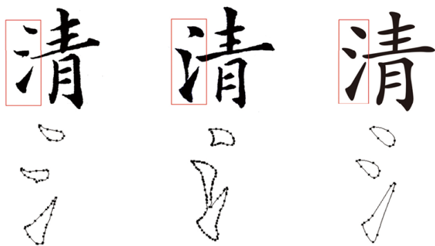
图1 笔画形态及节点分布对比 Fig.1 Comparison of stroke form and node distribution

书法是文字的书写艺术,其造型来源于一次性、不可修改的书写特质,所谓“唯笔软则奇怪生焉”,变化是其重要表现特征。现代字体的生成过程则完全不同,主要步骤为手写字稿、扫描输入、矢量描摹、笔画拼合、修整完善等一系列过程,如果要生成字库,还须通过国标的字形检测,最后整合成库。设计及制作完成很大程度上依托电脑技术,文字在电脑中被重新描绘、切割和布局,形成矢量节点围合的贝塞尔曲线,节点的分布经过反复调整,宗旨是合乎技术规范而又不丧失书法特征。本文以欧阳通《道因法师碑》及蔡襄《谢赐御书诗》中“清”字的“三点水”为例,两种字体均为楷书,且各有特色,“三点水”的点画或自然连带、或相互呼应,以追求变化为美;在计算机中描摹生成矢量形态后发现,笔画形态细节变化越多,形成的节点、曲线就越复杂,字库中的华文楷体的“三点水”,轮廓平滑规整,节点分布少而均匀,显然出于考虑技术规范尽可能地简化了节点,见图1。