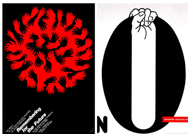
图7 福田繁雄作品中的适形与图底关系融合 Fig.7 Amalgamation of conformability and graph bottom in Fukuda Shigeo's works