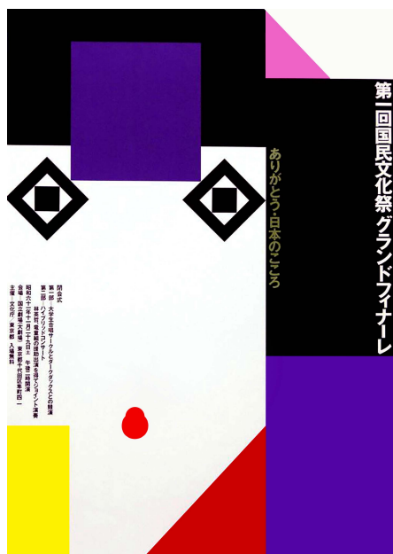
图5 田中一光作品中的传统图像 Fig.5 Traditional image in Tanaka's work