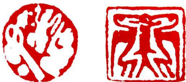
图3 组合适形中的均衡与对称变化 Fig.3 Equilibrium and symmetry changes in group proper shape