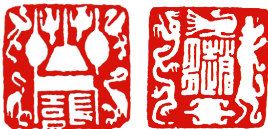
图6 汉代《长喜印》和《赵多印》 Fig.6 "Changxi Seal" and "Zhaoduo Seal" of Han dynasty

具有合理性和可延展性。更重要的是，多样化适形可以成为一种思路，对汉代肖形印多样化适形的继承和学习完全可以跳出汉代肖形印本身的表层图形特征，转而将肖形印的图形构建逻辑与现代图创成果结合起来，完成法度之上的转化和更新。例如在福田繁雄的作品中，就能看到许多将适形与对比、共生等设计方法结合起来的，福田繁雄作品中的适形与图底关系融合见图7。试想如果把汉代肖形印的多样化适形与这些设计手段结合起来，必然可以碰撞出许多有趣的创意火花，传承和创新也可借此寻找交集的可能。