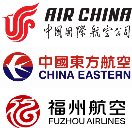
图4 航空类标志的象征图形运用 Fig.4 Symbols of aeronautical logo