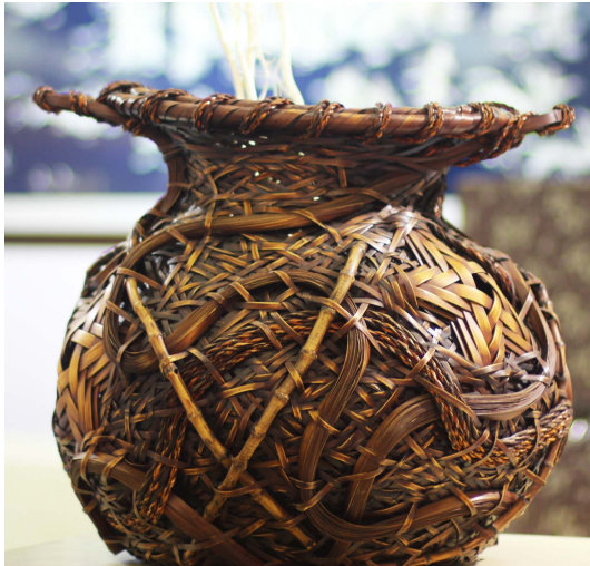
图3 竹编花器 Fig.3 Bamboo weaving vase