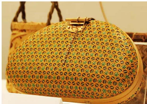
图2 竹编手包 Fig.2 Bamboo weaving handbag

以浙江竹编创意工作室“竹芸工房”为例，为符合现代人的审美，吸引年轻人的关注，他们对传统竹篮造型进行了拓展设计，运用多种编织技法、扎口装配技法，制作了竹编手包（见图2），其别致造型、精美做工令人惊艳，在网络上一发布立即吸粉无数。他们随后又设计制作了花器（见图3）、纸巾盒、小果盒、收纳盒、沐浴篮等，这些工艺品美观又实用，还带有浓浓的传统风格与天然材质的温情，取得了较好的传播效果。此外，还可以利用竹编的柔软性和包裹性，与现代工业产品相结合，制作成音箱外壳、灯罩等，竹编工艺的质朴温暖调和了现代科技产品的单调冰冷，赋予其传统工艺文化气质，拉近它们与人类之间的距离。