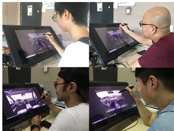
图4 实验对象描摹 Fig.4 Description of test subjects

被测者展示。要求被测者使用手绘屏对汽车内饰的造型元素(特征以及特征线)进行描摹,对被测者的描摹艺术水平不做限制,见图4。按照被描摹特征对象的先后顺序进行标注,此顺序在一定程度上代表某一特征或特征线对汽车内饰整体造型识别贡献度的强弱,同时也便于计算总特征数量。对单个实验样本的特征描摹数量不设上限,以被测者的穷举为准。为了提高实验的准确性,当被测者看到实验样本时,要求其依据自己的直觉以最快的速度对造型元素进行标注。特征线用红色标注,特征则用蓝色标注,实验完成后,依据实验实图整理的实验样本,见图5。由于两个参试者组别的专业背景不同,对实验设备熟练程度不一,描摹水平也有差异,为防止因此原因对造型元素的识别产生影响,先以其他与此实验无关的汽车内饰图片对两组部分成员进行设备熟练程度与描摹水平的测试。综合得出,对于每张图片的评价时间,设计师平均不超过1min,普通用户不超过100s,因此在正式的实验过程中,每张图的评价时间会严格控制在上述时间内。