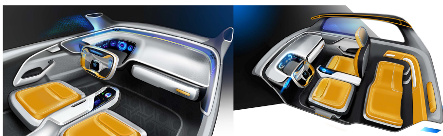
图7 某品牌新一代 E 系列电动车的内饰设计完成图 Fig.7 Design drawing of E series electric car interior in some brand