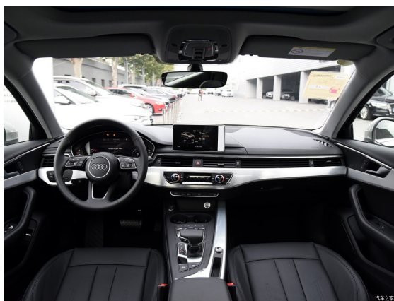
图2 全景展示中控台和方向盘的角度 Fig.2 Panoramic display of console and steering wheel angle

汪金莲等 [11] 对专家和新手在工程设计中的认知差异做了对比分析，也有作者从认知图式角度对个体