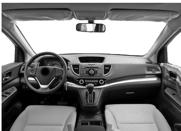
图3 实验样本处理 Fig.3 Sample processing

为了使样本尽可能地排除图面干扰,用图像处理软件对全部实验对象进行去色处理,将含有周围环境的部分,如车窗外的景象等带有暗示性质的元素排除在外,将这些区域以纯白色覆盖,见图3。