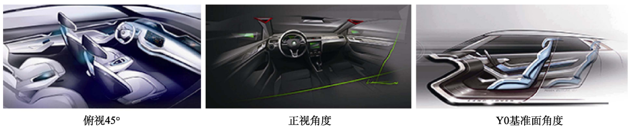
图1 汽车内饰的主要视角 Fig.1 Main perspective of the car interior

在汽车内饰设计领域，视图的主要展现角度为俯视45°，正视角度，以及以汽车Y0面为基准的角度，见图1。在这3个视角中，汽车Y0面视角重点展示汽车座椅及其内饰的人机布局，45°视图则几乎可探视内饰全景（包括座椅）。通过对各大汽车门户网站的汽车内饰图片进行分析，发现内饰的展示角度大多以全景展示中控台和方向盘为主，见图2（图片摘自汽车之家网站）。且此角度符合用户在使用汽车产品过程中的视觉认知，因此，依据此角度对内饰造型进行实验和认知测量，能得到符合用户群体场景的更加