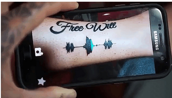
图2 手机应用“Soundwave Tattoos” Fig.2 “Soundwave Tattoos” App

新媒体艺术凭借媒介技术的支撑，为观众提供了多角度、多层次的感官刺激，无论是内容上还是形式上都极大地拓展了审美体验的维度。例如，2017年6月Skin Motion团队开发了一款手机应用“Soundwave Tattoos”见图2，可以用增强现实技术让纹身艺术变得更有意义。依据声波生成的纹身图案，成为了跨越时空的艺术介质，在表达铭刻信念与追求个性的同时，加载着一段可供反复播放的声音讯息。从纹身到声音还原的整套操作，十分明确地突出了审美体验中感知方式的多元、多维，强化了观众介入创作的能动性，标示着新媒体艺术引入艺术的感性经验和理性思考的融合性，可见具有时空范畴思量的多维审美体验正在悄然地介入并改变着人们的审美习惯。