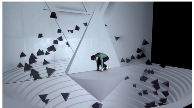
图3 Silasveta团队制作的“Levitation” 多媒体投影艺术与舞蹈秀 Fig.3 “Levitation” multimedia projection & dance show of Silasveta team