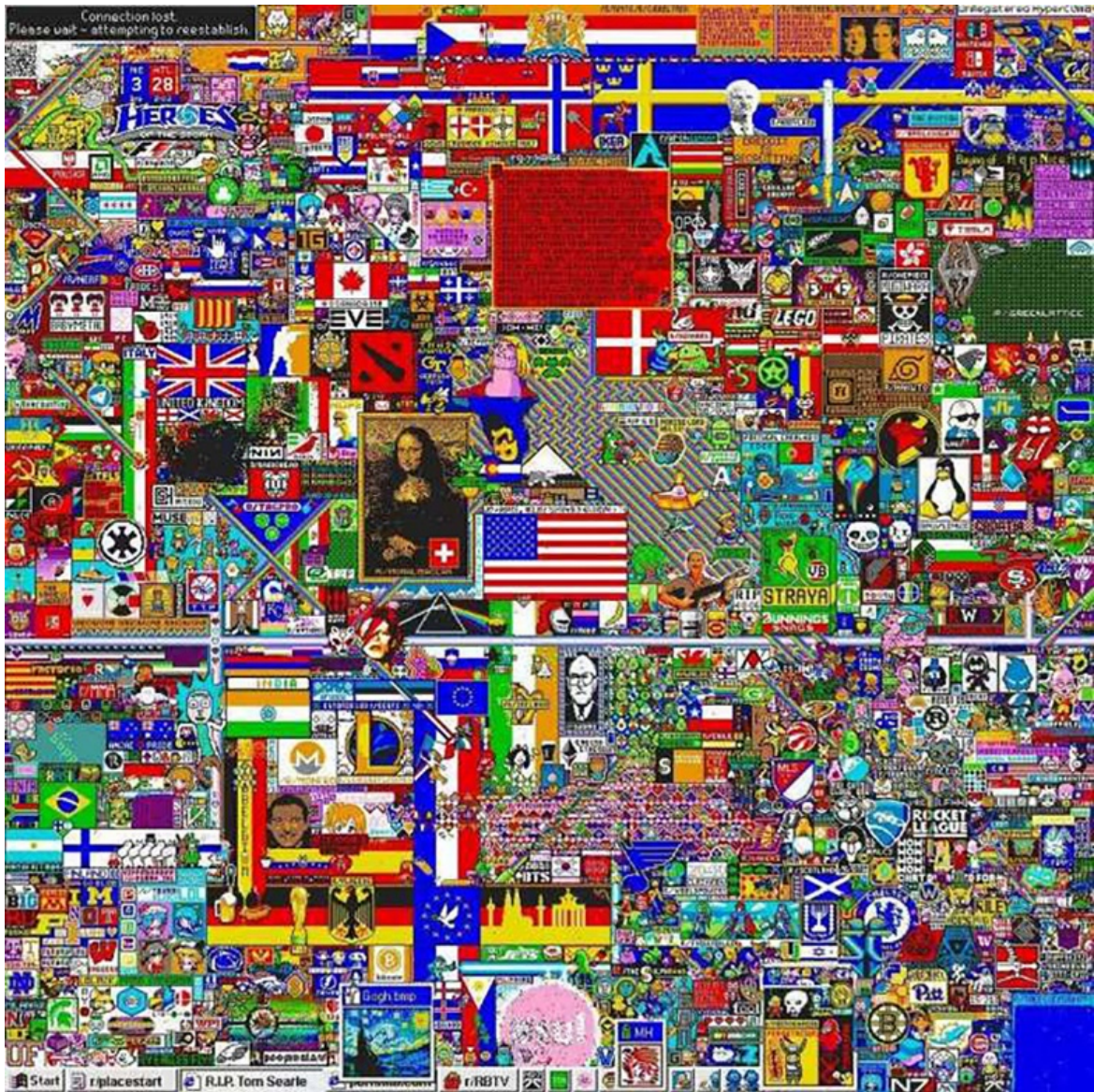
图 5 Reddit 社区“Place”网络绘图活动 Fig.5 "Place" network drawing activity of Reddit community

上的交互，但从时空维度剖析新媒体艺术的体验流程，会更加明晰交互状态的平等性、主动性、以及参与互动过程的重要性。通过设置多样的交互状态，不仅突破了艺术体验样式的局限，而且还丰富了艺术感知的层次，意识与存在之间的作用被放大，这就为新媒体艺术注入了广泛的哲思空间，也为艺术创作找到了多样的创新切入点。